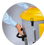
Secoueur de filtre manuel