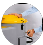
Secoueur de filtre manuel