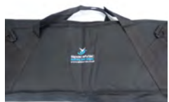
SV/PB 1x sac tube