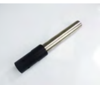
SV50/38RT 1x raccord rond 38mm