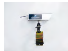
SV/CAM 1x caméra