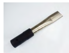
SV50/38CT 1x raccord plat

Consultez la section des accessoires pour trouver une gamme d'outils et de compléments au système de nettoyage extérieur SpaceVac.