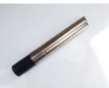
SV50/50ST 1x raccord droit 50mm