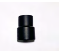
SV50/50HC 1 x 50mm Vac Inlet Cuff