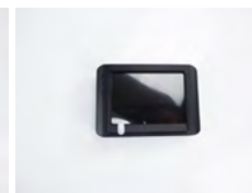
SV/MON 1x moniteur