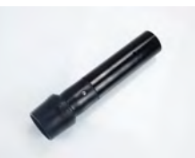
SV50/HA 1x adaptateur 50mm