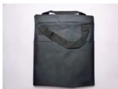
SV/HB 1x sac tuyau