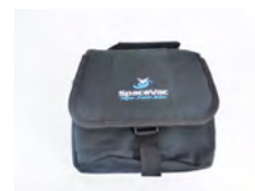
SV/CB 1x sac caméra