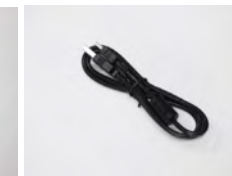
SVCAM/USB 1x cable USB