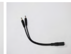
SVCAM/SPLITTER 1x cable jumeaux