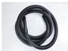
SV50/75H 1x tuyau 7m