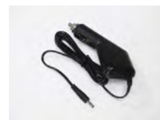
SVCAM/CAR 1x chargeur voiture