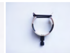
SV/CC clip caméra