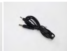
SVCAM/USBCHARGE 1x cable chargeur USB