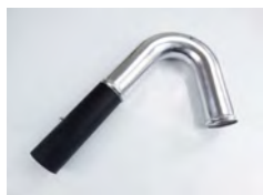
SV50/135H 1x raccord 135 degrés