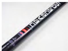
SV50/08-Classic 1 x 50mm o.8m demi Pole classique