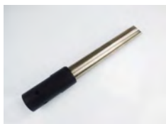
SV50/38ST 1x raccord droit 38mm